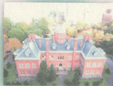
【北海道職員（北海道人事委員会事務局）】 広大な北海道をステージに、幅広い分野で活躍できる職場です。