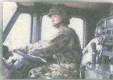
【自衛隊札幌地方協力本部】 あなたらしく輝ける仕事が見つかる。 100種類以上の多様な職種！