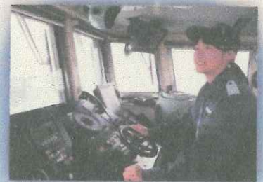
【第一管区海上保安本部（海上保安庁）】 男性だけでなく、女性も安心して働ける職場です。