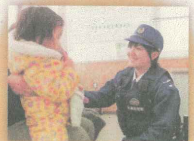
【北海道警察】 大切な人のために あなたの個性で、できることがある。