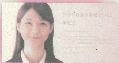
【札幌国税局】 税のスペシャリストが活躍する 専門性の高い職場です。