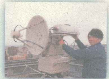
【北海道警察情報通信部】 警察庁の技術のプロフェッショナル集団