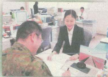
【陸上自衛隊北部方面総監部】 「あなたにもできる国防がここにある！」