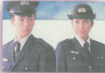
【刑務官（札幌矯正管区）】 一人の人間として、受刑者と向き合い、更生へと導く意義深い仕事です。