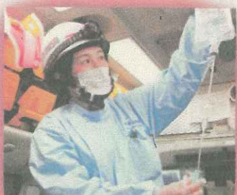
【札幌市消防局】 札幌市消防吏員という活躍の舞台があります。